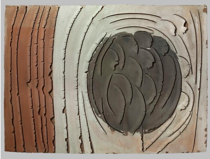
■ Sans titre Vers 1961 Terre cuite 60 x 80 cm