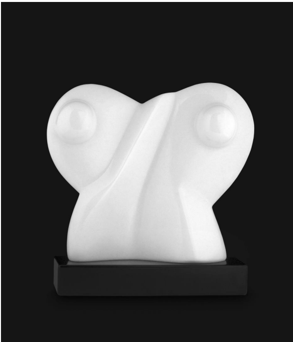
■ Forme abstraite