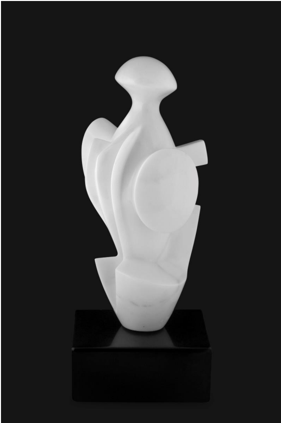
■ Guerrier grec Vers 1987

Marbre blanc de Grèce, socle marbre noir de Belgique