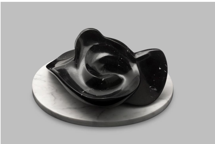
■ Rose noire